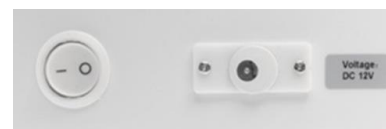
主電源 プラグ差し込み口